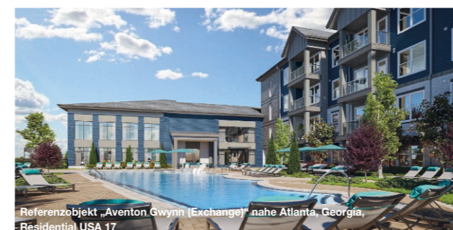
Referenzobjekt „Aventon Gwynn (Exchange)“ nahe Atlanta, Georgia, Residential USA 17