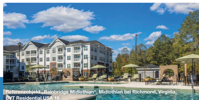
Referenzobjekt „Bainbridge Midlothian“, Midlothian bei Richmond, Virginia, BVT Residential USA 16

Im Fokus der BVT Residential USA Serie stehen Investitionen in die Entwicklung und die anschließende Veräußerung von „Class-A“-Apartmentanlagen an sorgfältig ausgewählten Standorten mit guten Wirtschaftsprognosen im sogenannten „Sunbelt“, also dem Südosten, bzw. an der Ostküste der USA. Hierzu gehören z.B. die Metropolregionen Boston, Washington, D.C., Orlando oder Atlanta. Mit 49 Jahren US-Immobilienenerfahrung, eigenen Büros in den USA und einem hauseigenen US-Steuerservice ist BVT ein starker und zuverlässiger Investitionspartner. Bislang wurden 20 Beteiligungsgesellschaften mit einem Investitionsvolumen von insgesamt über 2,5 Mrd. US-Dollar aufgelegt, die zusammen 34 Apartmentanlagen mit insgesamt über 10.500 Wohnungen entwickelt haben bzw. entwickeln. Elf Beteiligungsgesellschaften wurden bereits veräußert.